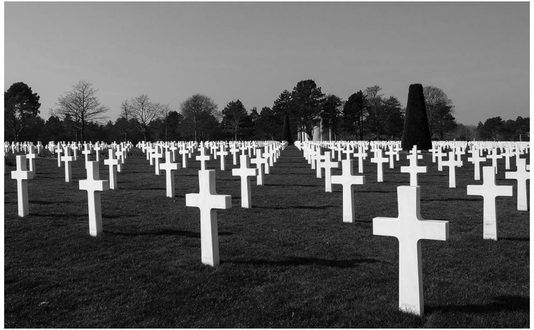
Amerikaans oorlogskerkhof, Colleville-sur-mer Normandië

In de toekomst worden de vruchten rijp van de zaden die we nu planten. Wat wij nu doen, heeft gevolgen voor de toekomst.